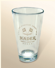
Latte macchiato glas

Art.-Nr. 5072-SET Untertasse mit Mäder-Logo gold