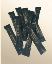
Zuckersticks Karton: 1000 Sticks á 3g Art.-Nr. 1500