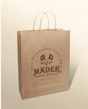
Mäder Papiertasche mit Logo Art.-Nr. 1038