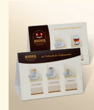
Tischauflager für Kaffeespezialitäten (Optimal für Gastronomiekunden) Art.-Nr. 1029