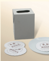
Mäder Tassendeckchen mit Logo Art.-Nr. 1900