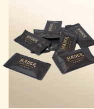
Mäder Karamel Kekse Inhalt: 1100g, einzeln verpackt, ca. 200 Stück Art.-Nr. 9006