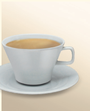
Milchkaffeetasse groß *1985*

Art.-Nr. 5066-SET Untertasse mit Mäder-Logo gold