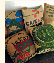
Kaffeekissen (Bezug abnehmbar) Motive wechselnd Art.-Nr. 1041