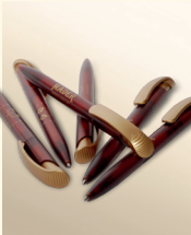
Mäder Kugelschreiber mit Logo Art.-Nr. 1659