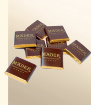
Mäder Schokolade Napolitains von VALRHONA 1000g, einzeln verpackt Art.-Nr. 1820